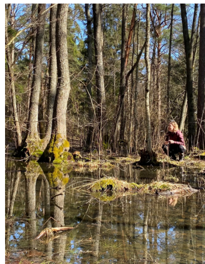
Älvsjöskogen vid olika årstider.