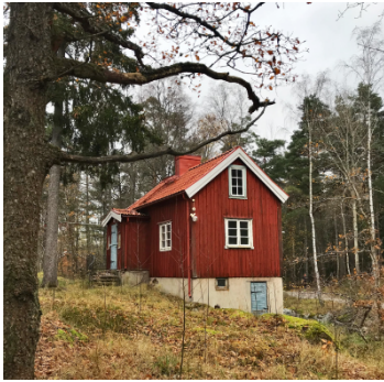
Röda stugan vid Korkskruven.

Det är däremot tillåtet att sätta upp tillfälliga markeringar som enkelt går att ta bort. Det kan till exempel vara band som fästs runt trädstammar eller grenar. Blir det för mycket märkningar har förvaltningen rätt att ta bort dessa. Önskar någon en långvarig uppsatt markering behöver särskilt tillstånd sökas.