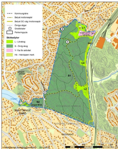
Karta över Älvsjöskogen.

I skogen finns två belysta motionsspår på 1,8 km och 3,8 km som sköts av förvaltningen. Flera av stadens så kallade Tysta platser finns belägna utmed leder och stigar i skogen. Älvsjöskogen används framförallt som närströvsområde för boende i Älvsjö och Stuvsta. Likaså nyttjar lokala idrotts- och friluftsföreningar samt även närbelägna skolor och förskolor skogen och den intilliggande idrottsplatsen.